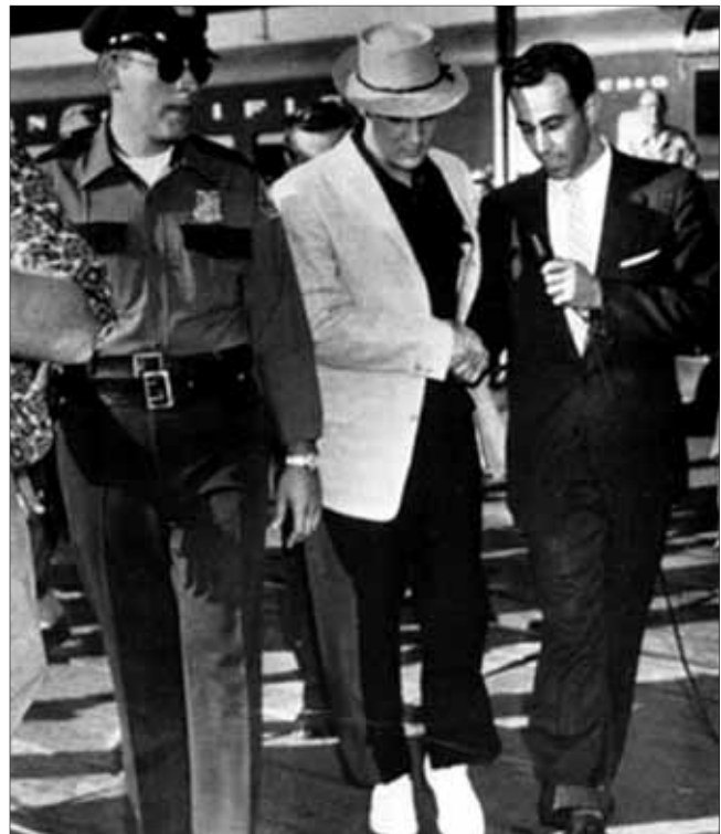
Elvis - Portland - 2. September 1957