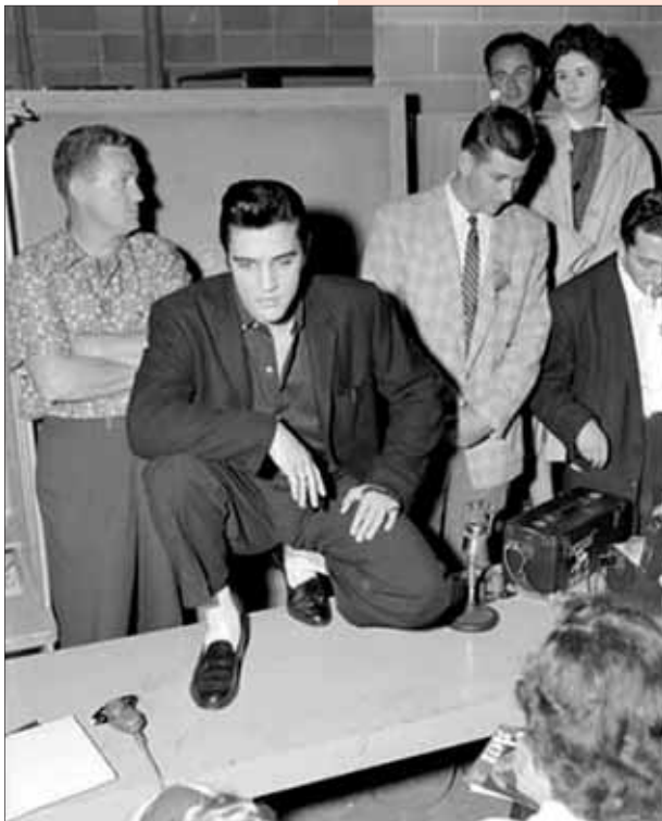
Elvis - Vancouver - 31. August 1957

Zwei Daten gibt es hierzu: den 6. Juni 1970, wobei für die Session die laufende Nummer ZPA4 1611 nicht belegt ist; laut RCA sei es nicht Elvis. (Es soll nach weiteren Angaben sogar damals jemand anderes gesungen haben?). Weiter den 14. November 1970 live in Los Angeles. Die Zeitschrift Variety soll sogar in einer Kritik von einer „contemporary (zeitgemäß) ballad“ geschrieben haben.